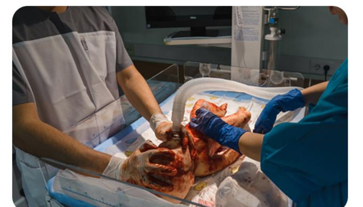
或机械呼吸机通气